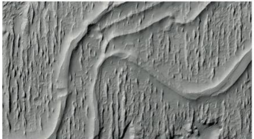
El hallazgo puede explicar adónde se fue el agua que irrigaba Marte hace millones de años.