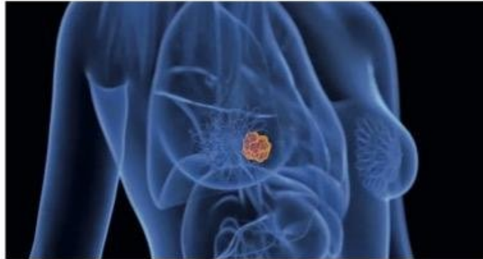
MIA logró detectar tumores que los doctores pasaron por alto.