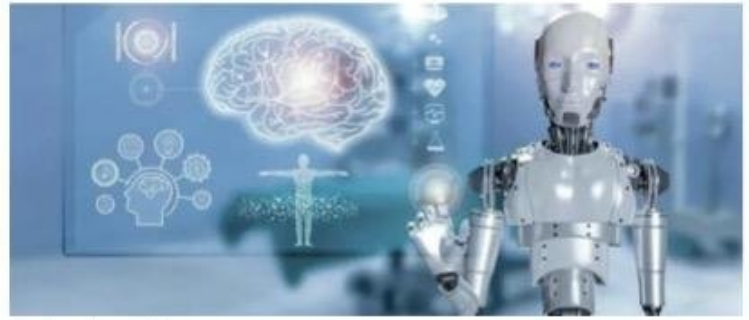
BBC Inteligencia artificial.

A continuación te presentamos algunos de los avances científicos y médicos que hicieron impacto a lo largo de 2024.