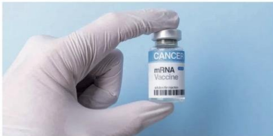
Las vacunas personalizadas se basan en el ARN mensajero (ARNm).