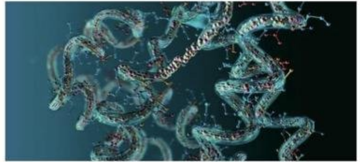
Una cadena de aminoácidos formando una proteína.

Y Demis Hassabis y John Jumper "desarrollaron un modelo de inteligencia artificial para resolver un problema de hace 50 años: predecir las estructuras complejas de las proteínas".