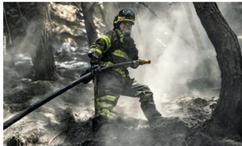
Incendios, inundaciones y olas de calor intenso son algunos de los efectos del calentamiento global en este último año.