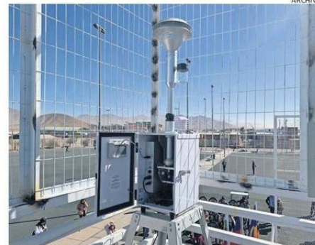
CODELCO INFORMÓ QUE RETIRARÁ 4 TONELADAS DE MATERIAL PARTICULADO.

“Es preocupante que mientras no se cuente con un nuevo Plan de Descontaminación Atmosférica para Calama tengamos medidas parches, y anula-