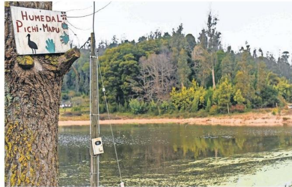
El humedal Pichi Mapu es un gran ejemplo del trabajo medioambiental de Concepción.

En ese proceso, además, Medio Ambiente ha estado asesorando y acompañando a los funcionarios municipales con capacitaciones. A eso se suman la entrega de recursos por medio de la subdere y otras vías de financiamiento para tener asesorías técnicas y entregar competencias a las administraciones locales, sobre todo teniendo en cuenta que hay comunas que carecen de equipos especializados, o donde un mismo funcionario está a cargo de cubrir muchos temas al mismo tiempo.