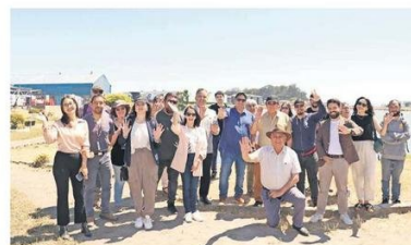
Talcahuano ya cuenta con su primer humedal urbano, el Redamo y Redacamo. Su declaratoria se concretó hace una semana.