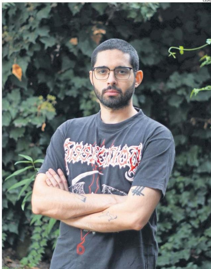
“ME PARECIÓ UN DEBER PUBLICAR ALGO PARA QUE SE HABLE DEL TEMA” SALUD MENTAL, DICE EL AUTOR.

—Afortunadamente soy independiente, no tengo que darle explicaciones a nadie y para mí es un tema súper importante: así como hay gente que tiene la bandera de lucha de los pueblos indígenas u otra causa, mi bandera es la salud mental, y tengo el privilegio de que se me da la escritura, que sé mucho del tema y me pareció más bien un deber publicar algo para que se hable del tema. (Aunque) a veces hablan mucho, pero no ha-