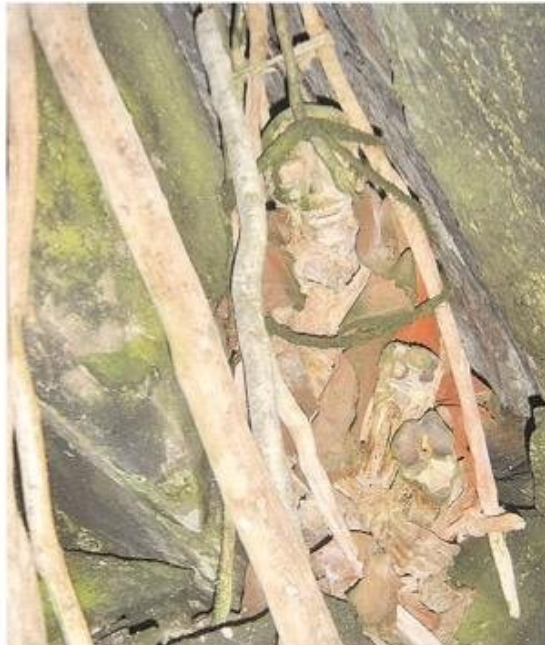
Posición y apariencia en la que fue encontrado el cuerpo en isla Capitán Aracena.

Para la realización de esta pieza periodística se analizaron los estudios que se realizaron respecto del cuer-