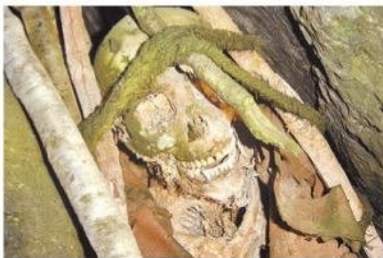
Los especialistas repararon en las condiciones en que se encontraba la dentadura.

do en isla Aracena es de unos 120 años antes del presente, lo que viene a coincidir con el periodo de mayor auge y expansión en los contactos con poblaciones a través del estrecho de Magallanes. Además, diversos marcadores genéticos, dan a entender de que se trataba de una mujer concebida de un matrimonio mixto. "Los marcadores genéticos no eran