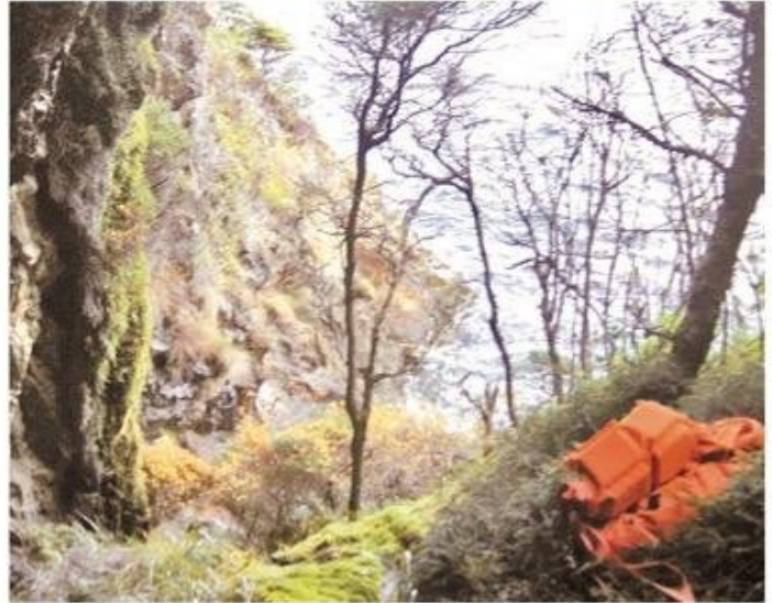
Vista desde lejos del lugar donde fue encontrado el cadáver.