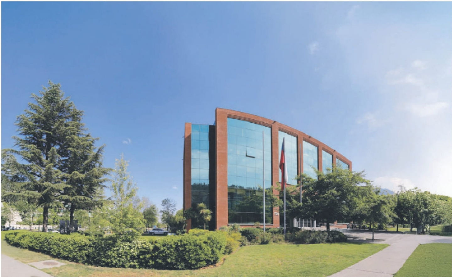
El nuevo Parque de Ciencia, Innovación y Emprendimiento de la Universidad San Sebastián en Huechuraba.

los cambios regulatorios que se discuten en el Congreso, hemos alcanzado un modelo de gestión que permite comprometer en estos proyectos US$ 65 millones”, afirma el rector de la casa de estudios, Hugo Lavados. “En la sede Concepción -agrega la autoridad universitaria- se adquirió un terreno en calle Paicaví, en el que se va a construir un edificio de 15.000 m 2 que se espera inaugurar en 2027. En Valdivia, a su vez, se va a habilitar el próximo año un segundo Centro de Salud docente-asistencial para el desarrollo de las carreras del área de la salud, el que debería entrar en funcionamiento a fines de 2025. Estamos analizando, además, lo que se hará en la sede De la Patagonia, por la importancia de la región y de Puerto Montt”.