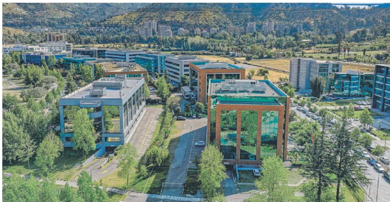
El nuevo campus Ciudad Universitaria, en Huechuraba, de la Universidad San Sebastián, consta de cinco modernos edificios para gestión, docencia e investigación.