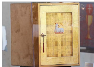
La creadora Soledad Chadwick recurrió al dorado, que simboliza los atributos divinos y también a la figura del cordero pascual.