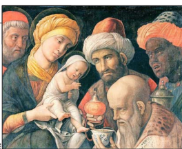
La repercusión universal del nacimiento de Jesús. Según explicó Benedicto XVI, 'los hombres que llegan de Oriente personifican a los pueblos del mundo, a la Iglesia de los gentiles, a los hombres que a lo largo de los siglos se ponen en marcha hacia el niño de

católicos, hay también algunos rasgos del pesebre, como la presencia en él de un buey y un burro, que dan calor al niño. En el evangelio de Mateo se menciona a los reyes magos. Se supone que estos personajes venían de Babilonia —un Mesopotamia—, un importante centro astronómico y astrología. Más que reyes, habrían sido sabios o sacerdotes. Según Samuel Fernández, 'el término griego 'mago' indica un astrónomo persa capaz de interpretar sueños. La tradición fue amplificando el relato y agregando detalles'. Un mosaico del siglo VI, en Ravena, muestra a los magos con sus tres nombres: Melchor, Gaspar y Baltazar, que aparecen en un evangelio apócrifo. Los magos de Oriente represen-