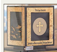
'Usé acrílico y pan de oro', cuenta Chomali de su sagrario. 'Y cuando me nombraron cardenal, me auxilió una buena samaritana'.