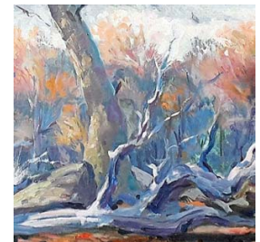
ÓLEO. El pintor creció en esta zona y ha visto en detalle cada cambio.