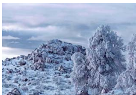
INVIERNO. Así ve esa estación en una de las zonas más altas de la reserva.

POR Marcela Saavedra Araya.