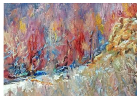
OTOÑO. Su trabajo en óleo recoge esa estación en Cantillana.