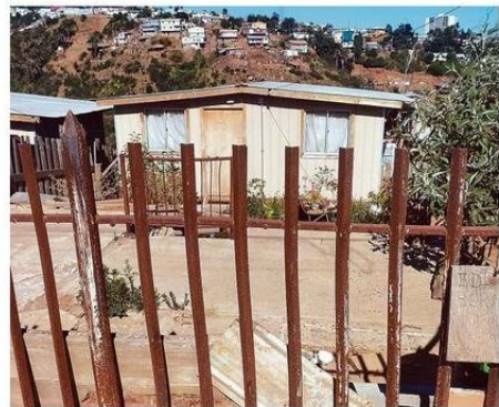
FAMILIAS QUE SIGUEN EN ESTRECHAS VIVIENDAS DE EMERGENCIA.

En Forestal, Nueva Aurora y los sectores aledaños arrasados por el siniestro del 22 de diciembre de 2022, siguen con las huellas imborrables de la tragedia en su diario vivir. Minvu dice que 2 de cada 3 damnificados cuentan con vivienda.