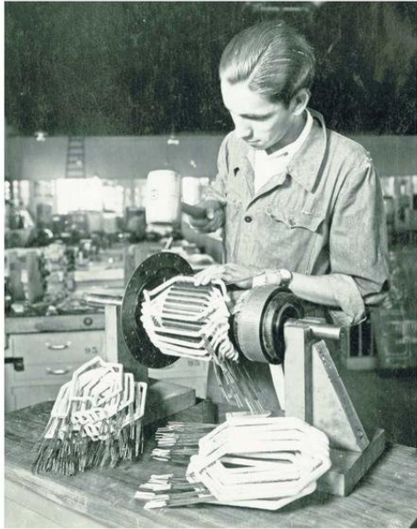
La imagen muestra a un alumno de la Escuela de Artes y Oficios en 1930.

S i bien la Educación Técnico Profesional en nuestro país tiene más de 80 años de existencia formal, hay registros mucho más antiguos de este tipo de enseñanza, los cuales datan del siglo XVIII, encontrándose un primer antecedente en 1798, cuando Manuel de Salas Corbalán creó la Academia San Luis, siendo su primer director. Esta fue dotada con profesores europeos con el fin de fortalecer los conocimientos en matemática, geometría y dibujo.