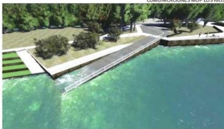
COMUNICACIONES MOP LOS RÍOS.

La iniciativa incluye la mejora de 400 metros lineales en el balneario de Cocule, a orillas del río Bueno, que tradicionalmente tiene buena afluencia de público en época estival. Los trabajos contemplan la protección del borde fluvial con enrocados. También se habilitará un embarcadero, para naves menores con un muelle, mientras en el sector de la playa se construirá una explanada, que incluirá