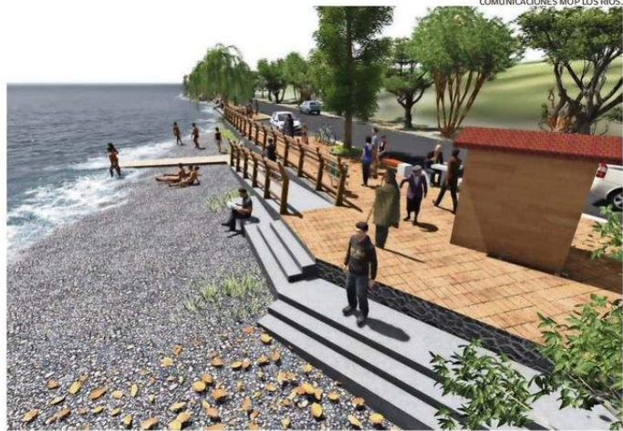
COMUNICACIONES MOP LOS RÍOS.