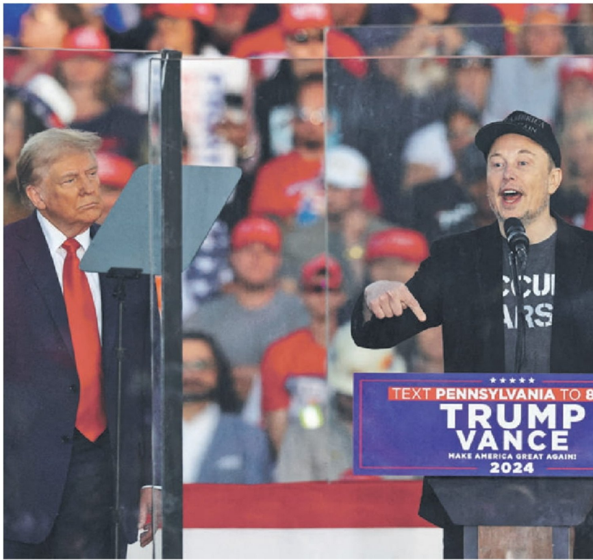
► Donald Trump observa a Elon Musk durante un acto de campaña.