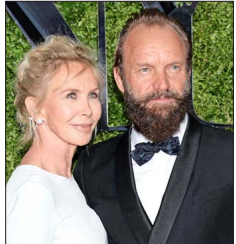
Sting junto a su esposa, Trudie Styler, en 2015.

Su preocupación ecológica también lo llevó a colaborar con Carlos de Inglaterra en la campaña Prince's Rainforest Project. Juntos hicieron un llamado a los defensores del medio ambiente para enviar mensajes de texto con un SOS, con el fin de frenar la destrucción de las selvas tropicales.