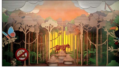
Uno de los proyectos en que ha participado Marion Cotillard es el video "El silencio de la Amazonía en crisis".

En 2014, Cotillard narró "El silencio de la Amazonía en crisis", un video de Greenpeace que denuncia la ex-