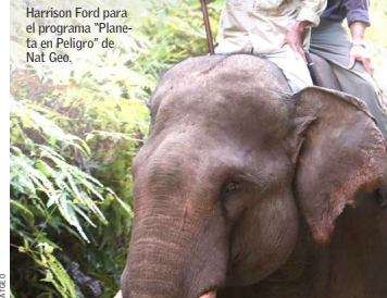
Harrison Ford para el programa "Planeta en Peligro" de Nat Geo.

Además, su compromiso con la conservación quedó reflejado en la compra del rancho Jackson en Wyoming, donde donó la mitad de las tierras al proyecto Jackson Hole Land Trust, destinado a proteger los paisajes naturales de la región. Su dedicación ha sido reconocida con numerosos premios, como el Premio Lindeberg y el Jules Verne Spirit of Nature Award.