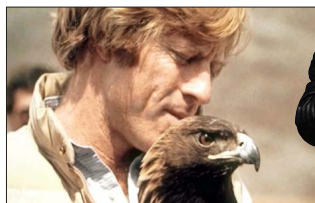
El Centro Redford nació en 2005 para desarrollar proyectos de cine vinculados a la protección de los espacios naturales.