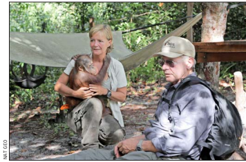
El protagonista de "Indiana Jones" es miembro de la junta directiva del Fondo de Conservación Global de Conservation International.