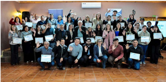
El programa “Impulsa Agua” ha desarrollado una serie de capacitaciones con el fin de mejorar la administración de los SSR.