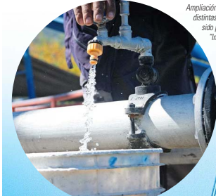
Ampliación de matrices en distintas localidades han sido posible gracias a “Impulsa Agua”.