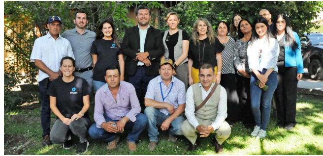
Vecinos de Codegua, beneficiarios de “Impulsa Agua”, junto al equipo de Agrosuper y Fundación Amulén.