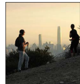
Incendio forestal declarado en la tarde de ayer en las comunas de Padre Hurtado y Melipilla deja a la capital cubierta de humo. | C 10