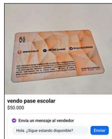
La TNE es comercializada a través de internet, al igual que sus sellos.

ca de la Escuela de Ingeniería de Construcción y Transporte de la Pontificia Universidad Católica de Valparaíso, explica que "muchos estudiantes pasan la tarjeta a familiares, y por eso se hacen más viajes durante el día. Además, hay gente que está ven-