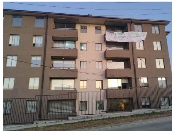
LOS VECINOS DENUNCIAN MALA CALIDAD en la construcción de sus departamentos.