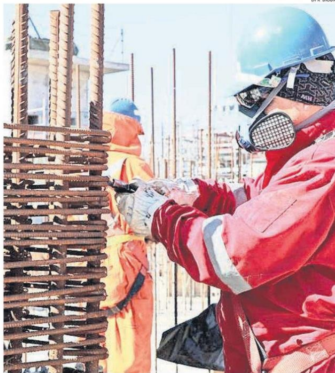
LAS LARGAS ESPERAS, SEGÚN EXPERTOS, SIN DUDA AFECTA A LAS OPORTUNIDADES LABORALES.

“Por tanto, conocemos de cerca esta realidad. Creemos que la permiso-