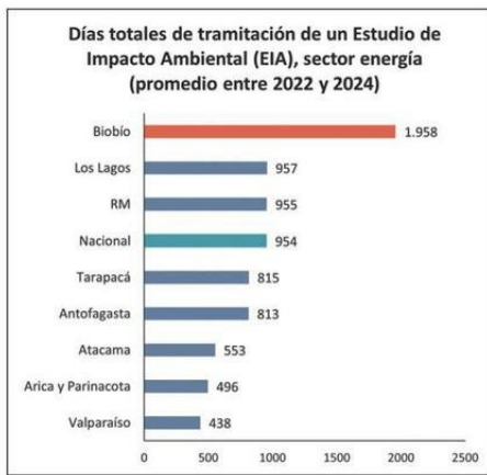
EL SECTOR ENERGÍA DEMORA 1.958 DÍAS EN OBTENER PERMISOS.

es la tasa de desocupación en la región del Biobío durante el último trimestre.