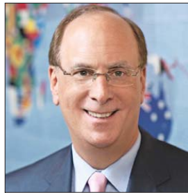
Larry Fink, de BlackRock.