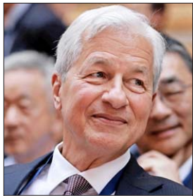
Jamie Dimon, de JPMorgan.

Puesto que los precios suben y las firmas de criptomonedas est n llenas de efectivo, algunos de los principales bancos y administradoras de activos en Wall Street est n tratando de aprovechar el resurgimiento. Otros siguen evitando lo que consideran una burbuja especulativa. A continuaci n, c mo han evolucionado los puntos de vista de algunos de los inversionistas m s grandes del mundo a trav s del tiempo: