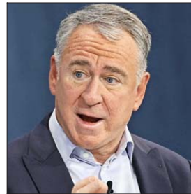
Ken Griffin, de Citadel.

El bitc on tard  unos 15 a os desde su creaci n en superar los US$ 100 mil. A lo largo del camino, la moneda digital experiment  repuntes febriles y caidas espectaculares. Hoy en d a, nuevamente es predominante en Washington y un activo de US$ 2 billones. Sin embargo, algunas de las luminarias m s grandes de Wall Street a n no est n convencidas de su valor.