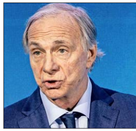
Ray Dalio, de Bridgewater.

Dimon como "estafas piramidales descentralizadas" y sugiri  que el gobierno deber a "cerrarlo definitivamente".