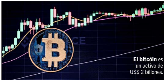
El bitc on es un activo de US$ 2 billones.