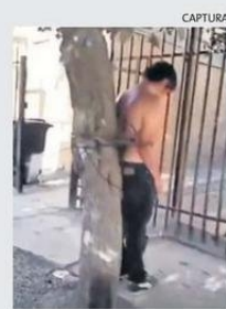
LO AMARRARON A UN ÁRBOL.

● Vecinos de Puente Alto golpearon y ataron a un árbol a un hombre de 28 años, que habría intentado abusar sexualmente de una niña de 11 años. El hecho ocurrió en la noche del martes en el pasaje Bizet, donde la madre de la menor acusó al sujeto de tratar de cometer actos contra su hija, por lo que vecinos lo golpearon y amarraron hasta que llegó Carabineros, que lo detuvo y lo llevó a constatar lesiones. Según Emol, una hermana de la niña fue