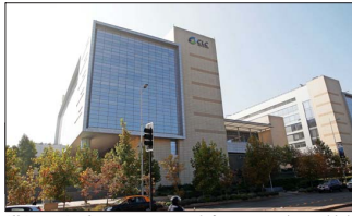
Clínica Las Condes arrastra una situación financiera compleja. Ha debido realizar un aumento de capital y enajenar activos inmobiliarios.