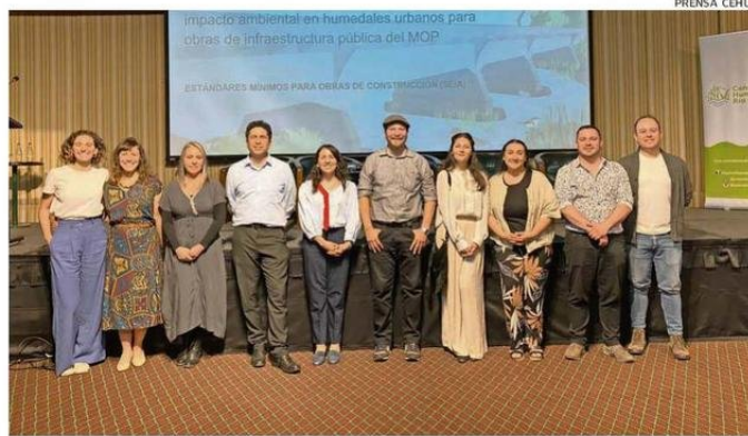
EL EQUIPO DEL CENTRO DE HUMEDALES TRABAJÓ EN LA INICIATIVA PRESENTADA PARA EL MOP.

El estudio consideró el análisis de más de 2 mil contratos de obras del MOP, teniendo en