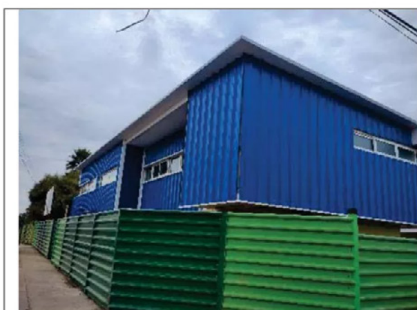
Fotografía N°: 1.

Materia: Revestimiento fachadas edificio 1.