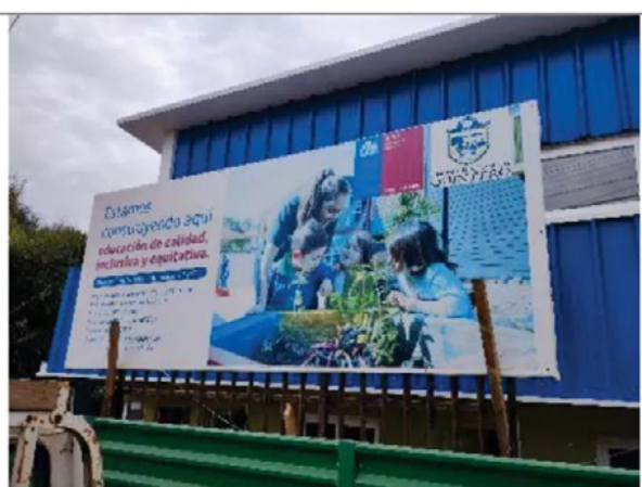
Fotografía N°: 2.

Materia: Revestimiento fachadas edificio 1.