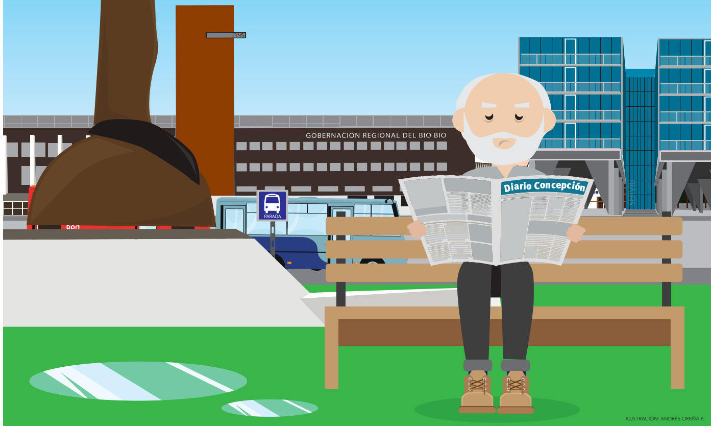
ILUSTRACIÓN: ANDRÉS OREÑA P.

Eduardo Bascuñán contacto@diarioconcepcion.cl