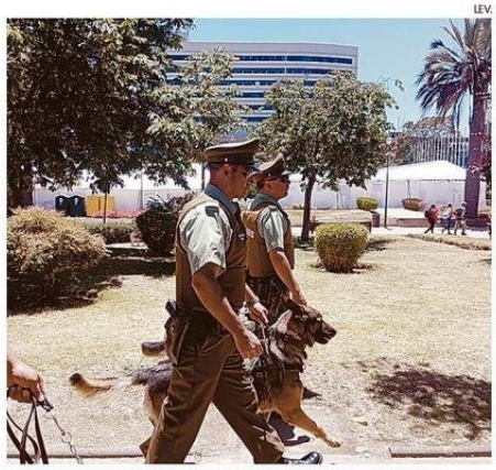
CARABINEROS AFIRMA QUE REALIZA SERVICIOS CONSTANTES.