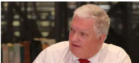
El senador Kusanovic destacó la necesidad de promover el Territorio Chileno Antártico.