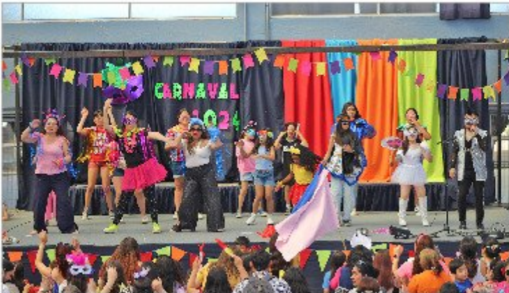
La actividad que marcó un hito en el calendario escolar al conmemorar los 16 años de aniversario del establecimiento educacional.