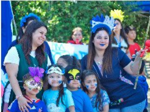
Los niños vistieron prendas de los colores que representan los sellos y valores del colegio Leonardo Davinci.