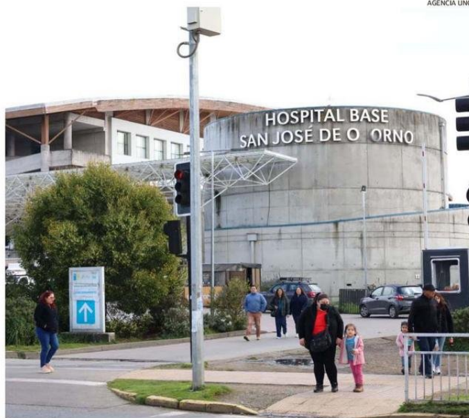
LA CONTRALORÍA DETECTÓ IRREGULARIDADES EN LAS LISTAS DE ESPERA DEL HOSPITAL DE OSORNO.