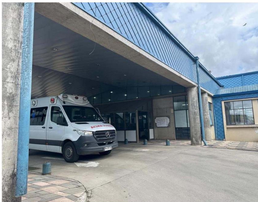
UNA MAYOR INFRAESTRUCTURA REQUIERE EL HOSPITAL DE CASTRO PARA TERMINAR CON EL COLAPSO DENUNCIADO POR DIRIGENTE.

Sobre las medidas adoptadas por la autoridad frente a la