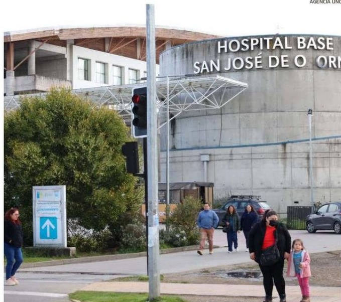
LA CONTRALORÍA DETECTÓ IRREGULARIDADES EN LAS LISTAS DE ESPERA DEL HOSPITAL DE OSORNO.