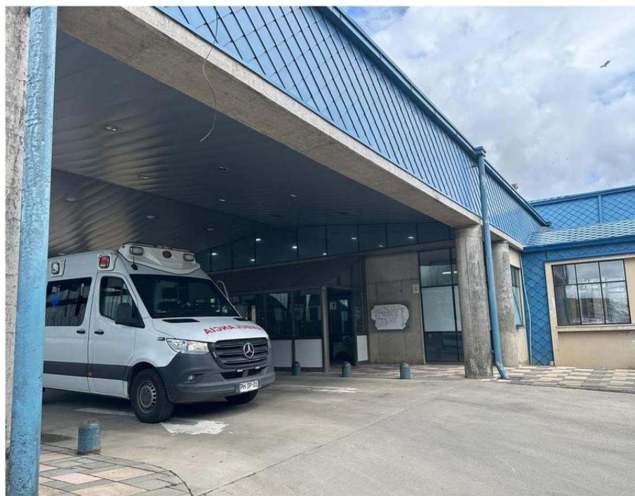
UNA MAYOR INFRAESTRUCTURA REQUIERE EL HOSPITAL DE CASTRO PARA TERMINAR CON EL COLAPSO DENUNCIADO POR DIRIGENTE.

Sobre las medidas adoptadas por la autoridad frente a la