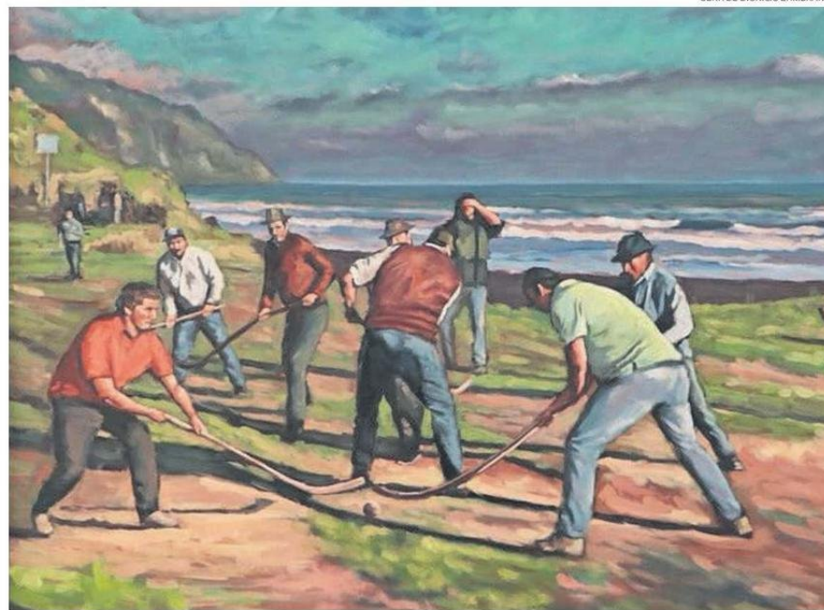
OBRA DE DIONICIO ZAMBRANO