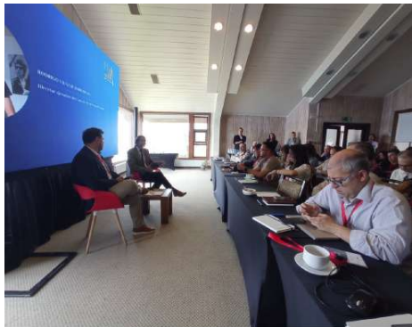
DESTACADOS EXPOSITORES ABORDARON TEMAS DE GRAN RELEVANCIA PARA EL FUTURO DE LA PRENSA NACIONAL.

y de calidad para mantener así la plena vitalidad de la libertad de expresión, base fundamental de toda democracia.