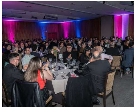
DURANTE LA CENA ANUAL DE LA PRENSA 2024, LA ANP ENTREGÓ IMPORTANTES RECONOCIMIENTOS.