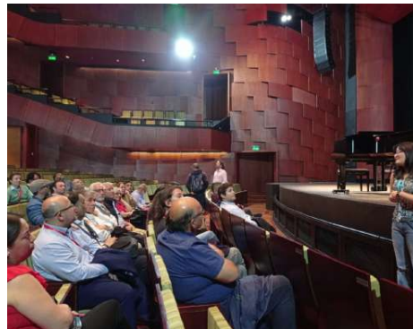
EL IMPRESIONANTE TEATRO DEL LAGO DE PUERTO VARAS FUE VISITADO POR LOS ASISTENTES AL ENCUENTRO.