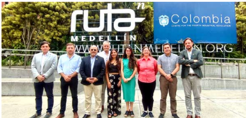
Como parte de las actividades del FIC-R Distrito de Innovación de Ñuble, en marzo pasado, una delegación de Ñuble realizó una visita técnica a Ruta N, en Medellín, para conocer la infraestructura, modelo de negocios y establecer vínculos.