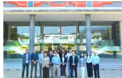
En noviembre, un grupo de representantes de Ñuble viajó a México a conocer y compartir experiencias con distritotec, impulsado por el TEC de Monterrey.

La invitación queda extendida a la comunidad para profundizar sobre el impacto transformador de un distrito de innovación en el territorio.