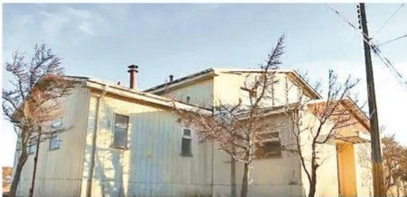
Las instalaciones que sirvieron de colegio.

En la década de los 60 el pueblo de Cullen, contaba con