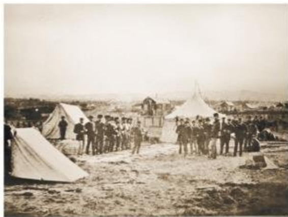
Julio Popper: financiado y apoyado por el doctor Joaquín Cullen en Punta Arenas, en 1886.

más de mil personas. Durante el año 1960 se finalizó el diseño del pueblo o campamento de Cullen junto a la planta de tratamiento de gasolina. En 1961 funciona la Escuela Mixta donde se enseñará a los niños y niñas fueguinos. Esta escuela pública que albergaba unos 40 alumnos en 1962 y 2 profesores; se le suma la inauguración de canchas de juegos infantiles. La Escuela tiene un kindergarten hasta 6° grado de enseñanza básica. Con la industria de energía empieza a prosperar y hermoear la localidad de Cullen que es ornamentada y se foresta con más de mil quinientos árboles, más de una variedad de arbustos, plantas menores y flores. En los sectores cívico y comercial se instalaban cercados y la localidad queda urbanizada. En este pueblo fueguino había 90 familias radicadas. El radio urbano tenía capilla, casino, posta médica, bomberos, gimnasio, cine y por supuesto su Escuela. Para fortalecer la educación