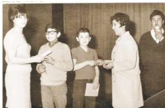
Alumnos de la Escuela G-42 de Cullen.