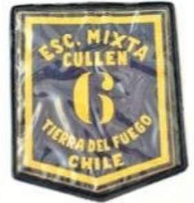
Insignia de la Escuela Mixta de Cullen.