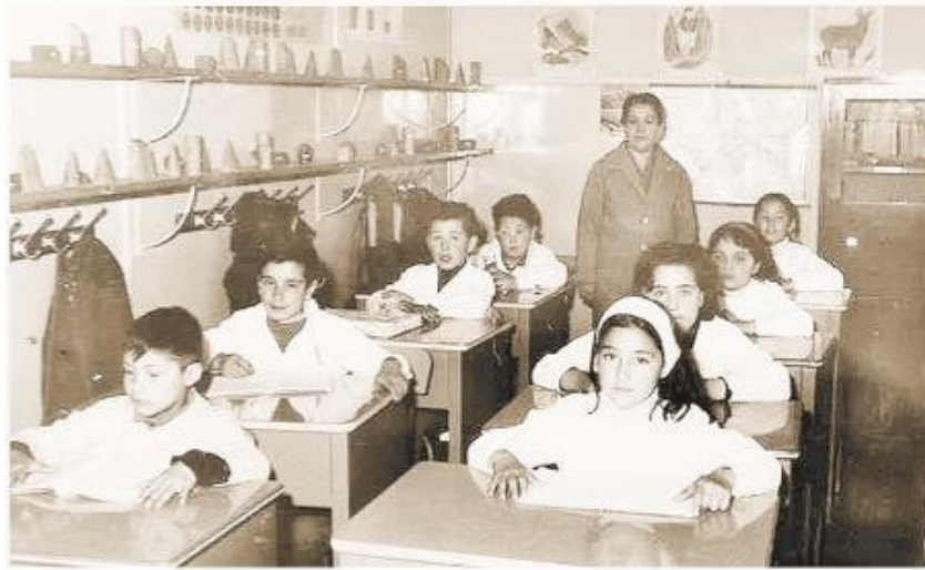
Sala de clases de la Escuela Mixta G-42 de Cullen, en 1966.