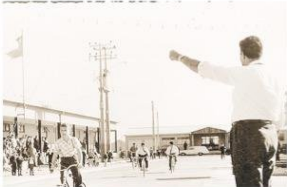
Competencia escolar en el poblado de Cullen.