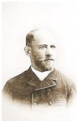
Ingeniero Julio Popper.

En 1965 la matrícula escolar creció a 65 alumnos y alumnas. En 1966 el administrador hace entrega de certificados a operarios egresados de la educación básica, que participaron en cursos intensivos durante tres meses, en horario vespertino. En actos escolares, niños de la Escuela Gabriela Mistral rinden homenaje a la Premio Nobel y Nacional Gabriela Mistral con rondas y declamaciones de sus poemas; quien como profesora de castellano ejerciera en Magallanes. En el año 1968 se inscriben trabajadores de la empresa estatal en los centros de estudios para adultos de Cullen. También se efectuará cursos vespertinos para primero y segundo año de humanidades, en los que participaron veinticin-