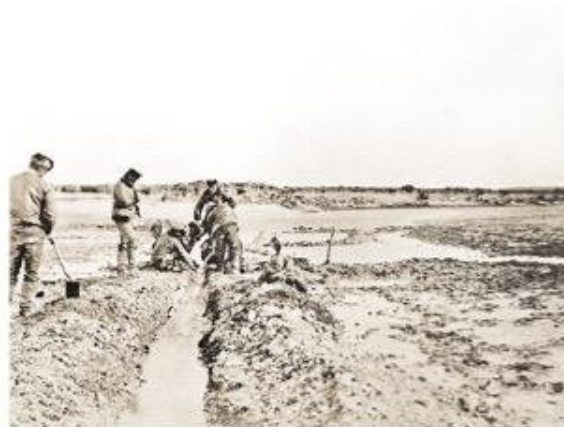
Expedición de Popper en río Cullen, Tierra del Fuego, en 1887.

En las décadas de los 70 y 80, se organizará administrativamente el territorio de Tierra del Fuego, sujetándose a la regionalización, provincialismo, comunalismo y municipalismo del país. Se dictan el Decreto Ley N°575 de 1974 sobre regionalización del país creándose la Región de Magallanes y de la Antártica Chilena; el Decreto Ley N°1.230 de 1975 que da origen a la provincia de Tierra del Fuego; el Decreto Ley N°2.868 de 1979 que divide la provincia en comunas y una de ellas es la comuna de Primavera donde una de sus localidades es Cullen y el decreto con fuerza N°1-2.868 de fecha 5 de ju-