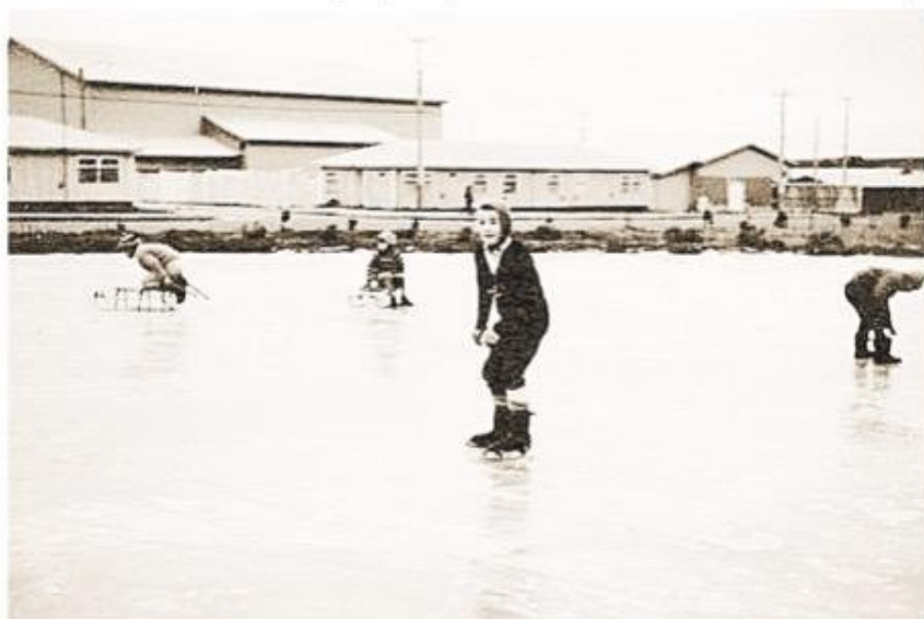
Pista de patinaje natural de hielo para disfrute de niños, jóvenes y habitantes de Cullen.

ma Segunda Región de Magallanes y de la Antártica Chilena queda como nueva denominación del establecimiento educacional Escuela G N°42 en el pueblo de Cullen. En los ochenta comienza la municipalización de la educación. Por su parte, en 1981 Enap se organiza como un holding de empresas. En 1984 se firma un contrato de compraventa de gas natural entre Enap y Signal Methanol y en 1988 se encuentran en producción treinta y seis pozos en nueve yacimientos costafuera que opera la empresa estatal. En 1990 se crea Sipetrol, Sociedad Internacional Petrolera S.A., filial de Enap, con el propósito de abordar las actividades de exploración y producción de petróleo y gas en el extranjero. Al correr el año 1992 se efectúa la obra pública de un poliducto Bandurria-Cullen para adquirir gas licuado de la República Argentina en el sector de la isla de Tierra del Fuego. Ya con la data de 1995 se cumple el cincuentenario de la comunidad petrolera magallánica chilena. Al finalizar el siglo veinte, en el 2000, se produce el aniversario de cincuenta años o medio siglo de la existencia de la Empresa Nacional del Petróleo, revalidando su gran labor económica, cultural y educativa en la Región de Magallanes.