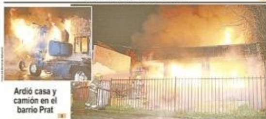
Ardió casa y camión en el barrio Prat