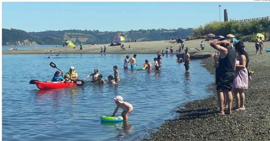
DEL 2 AL 4 DE FEBRERO DE 2019 SE VIVIÓ LA MAYOR OLA DE CALOR EN DÉCADAS EN CHILOÉ, CON MÁXIMAS QUE SOBREPASARON LOS 34°C.

Gobierno Regional entregará a los municipios de Los Lagos una herramienta con la que se pretende realizar una planificación territorial y reducir los riesgos del cambio climático.