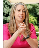
La embajadora de EE.UU. dejará Santiago por el cambio de mando en Washington.

Las debilidades del test psicológico de Conaf que aprobaron los acusados por el siniestro que originó la tragedia en Viña y Quilpué. | C 11