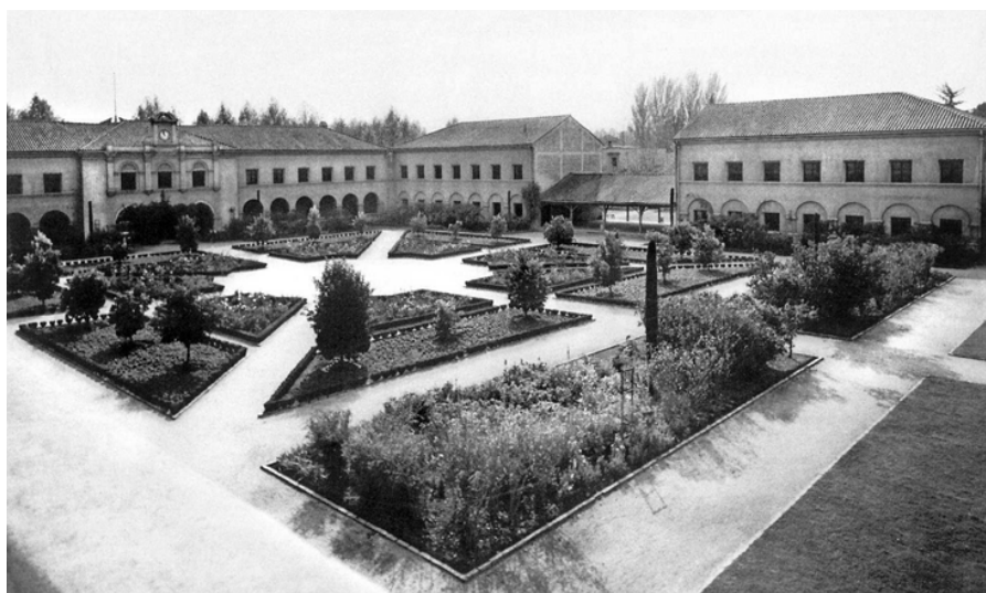
No se sabe quién fue el paisajista que proyectó los interesantes jardines que se suceden dentro del conjunto.

Se inauguró en 1932 y, en esa época, este edificio de estilo renacimiento español proyectado para el Santiago College por Josué Smith Solar era sinónimo de modernidad. Contaba con laboratorios, biblioteca, cocina, comedores y habitaciones para las alumnas internas. Tenía calefacción central, muy buena iluminación y ventilación y un logrado sistema de circulaciones que permitía el fácil desplazamiento de las alumnas a las salas para cada asignatura impartida, tal como en el sistema escolar norteamericano.