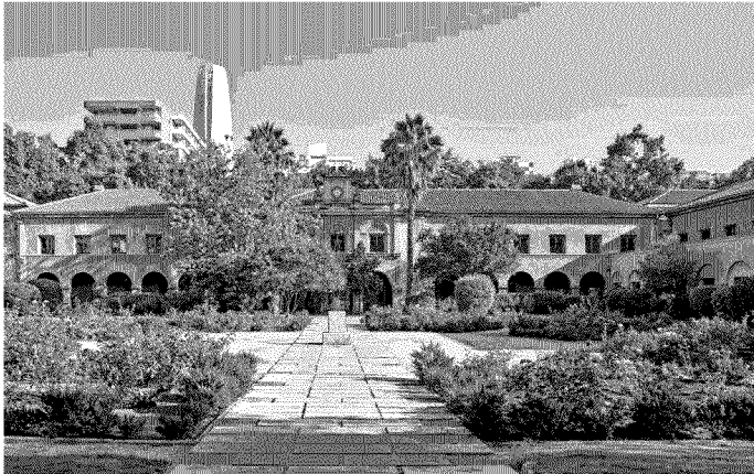
La obra, aunque de alto valor patrimonial, no cuenta con protección normativa.