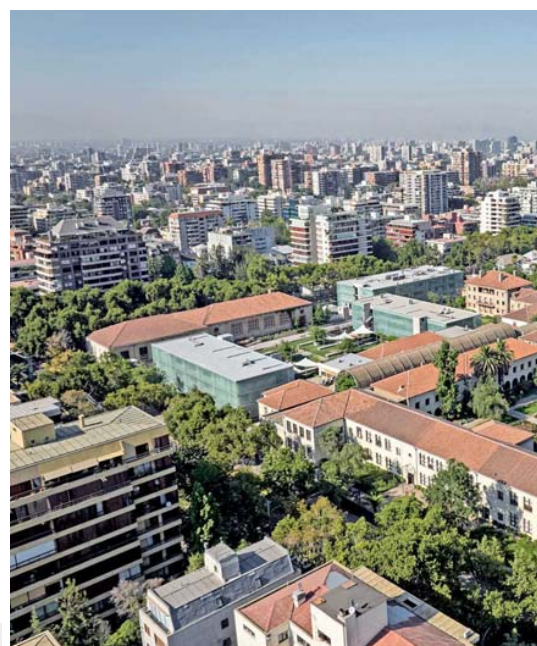
El exedificio del Santiago College es un hito urbano de la comuna de Providencia que se ha mantenido vigente en el tiempo.

Texto, Beatriz Montero Ward.