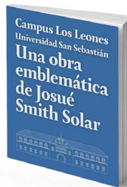
El inmueble cuenta con elementos propios del estilo renacimiento español.