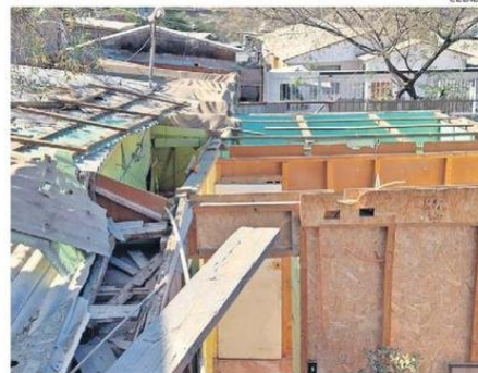
ESTÁN DESESPERADOS POR LA SITUACIÓN.

Por otro lado, este supuesto asesor engañó a otras familias que buscaban obtener ayuda para cubrir el monto del alquiler. "Él inventó que había un subsidio de arriendo e hizo firmar contrato. No hay subsidio de nada, porque no están vi-