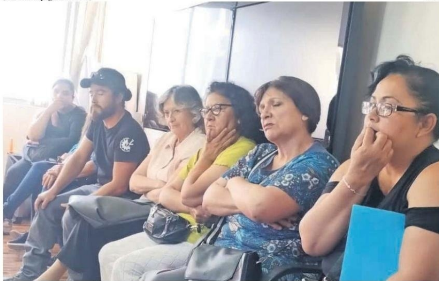
SE REUNIERON EN LA DELEGACIÓN AYER.