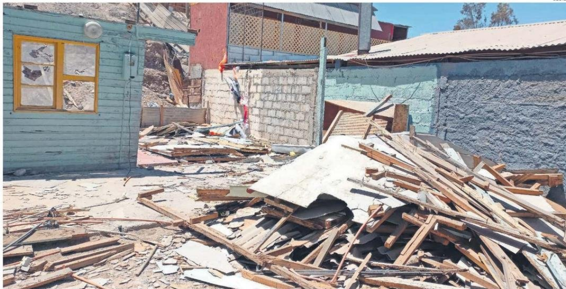
FAMILIAS DERRIBARON SUS CASAS POR PROMESAS DE PRONTA CONSTRUCCIÓN DE VIVIENDA DEFINITIVA.

El comité de vivienda "Ilusión" está conformado por siete familias, representadas por mujeres jefas de hogar, el beneficio al que supuestamente estaban postulando se denomina DSI-Tramo 3: Subsidio habitacional para construir una vi-