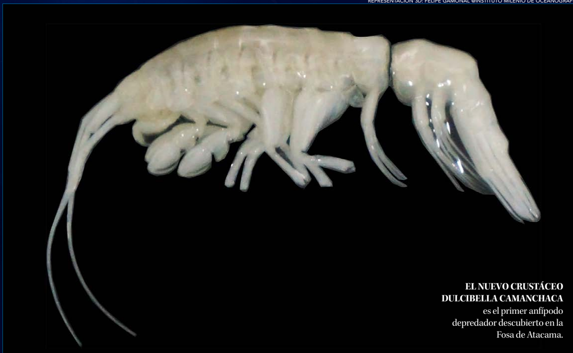
EL NUEVO CRUSTÁCEO DULCIBELLA CAMANCHACA es el primer anfípodo depredador descubierto en la Fosa de Atacama.