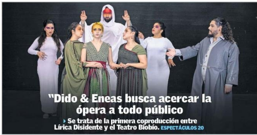
"Dido & Eneas busca acercar la ópera a todo público" ▶ Se trata de la primera coproducción entre Lírica Disidente y el Teatro Biobío. ESPECTÁCULOS 20