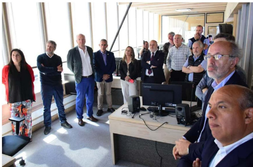
LOS ASISTENTES CONOCIERON LAS INSTALACIONES de Mininco y observaron el trabajo preventivo y coordinado en materia de incendios forestales.

El gerente de CMPC reconoció avances en esta materia, pero señaló que “todavía queda un largo camino por recorrer”. Según Lira, ha habido una disminución en los atentados y el robo de madera, pero enfatizó la necesidad de consolidar la seguridad y el Estado de Derecho como pilares del desarrollo sostenible en la región.