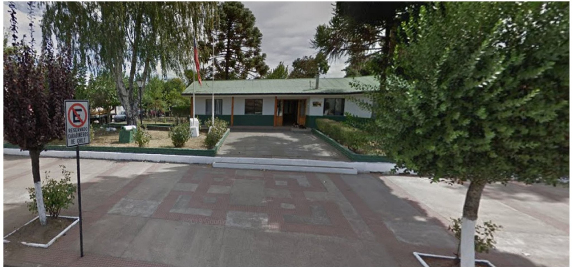
UNO DE LOS PROYECTOS más significativos será la reposición de la 5ª Comisaría de Carabineros en Yumbel.

Uno de los proyectos más significativos será la reposición de la 5ª Comisaría de Carabineros en Yumbel, con impacto directo en la seguridad local y generación de empleos. Además, el presupuesto destinado a la policía uniformada aumentará en un 12,5%, permitiendo la incorporación de 1.300 nuevos efectivos y la renovación del parque