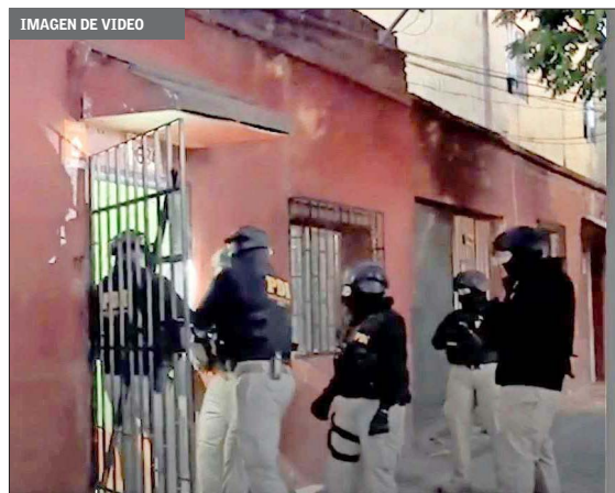
ALLANAMIENTOS. — Detectives de la PDI realizaron múltiples allanamientos en la Región Metropolitana. Los detenidos sumaron nueve.

Ayer se realizó una serie de allanamientos en diversas comunas de la capital, donde se incautaron seis vehículos, dispositivos de pago, droga, joyas y dinero en efectivo, entre otras especies. El fiscal Jorge Reyes indicó que "se puede determinar que ambos líderes de la banda tenían un patrimonio importante que había sido producto