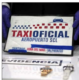
FALSAS IDENTIFICACIONES. — Red utilizaba carteles para simular estar reguladas.

El mecanismo para robarles: los imputados aprovechaban que a la salida del aeropuerto la mayoría de los turistas perdía la conexión a internet, y si