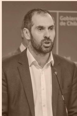
NICOLÁS GRAU MINISTRO DE ECONOMÍA

"Esto demuestra que la institucionalidad de todas maneras funciona", dijo respecto a la señal que muestra el fallo al resto de los proyectos de inversión.