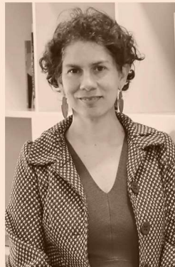
MAISA ROJAS MINISTRA DE MEDIO AMBIENTE

"Esta votación hay que repetirla". Sobre la reforma a la ley que regula el SEA, indicó: "Nuestra propuesta es que deje de existir el Comité de Ministros".