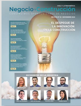
Edición 59 - noviembre 2024