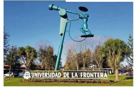
LA JUNTA DIRECTIVA CONFORMARÁ UN COMITÉ DE CRISIS QUE PERMITA INICIAR UN PROCESO ELECCIONARIO PARA UN NUEVO RECTOR O RECTORA.