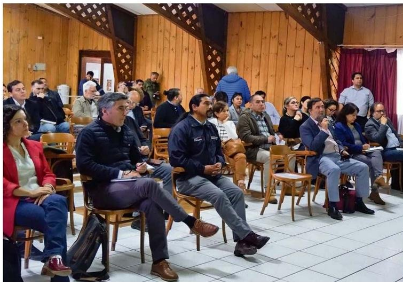
En La Araucanía se reunieron productores agrícolas, autoridades y gremios vinculados a la cadena trigo-harina-pan.

“La agricultura de contrato puede ser una herramienta efectiva para reducir la incertidumbre y