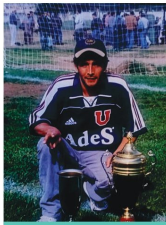
Junto a trofeos que obtuvo en sus momentos de gloria.