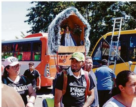
LA CREATIVIDAD DE LOS FELIGRESES SE SUPERA AÑO A AÑO.

mero de fieles alcanzó un histórico millón y medio de personas. En general, el balance de la jornada fue positivo, ya que, pese a la masiva asistencia, no se re-