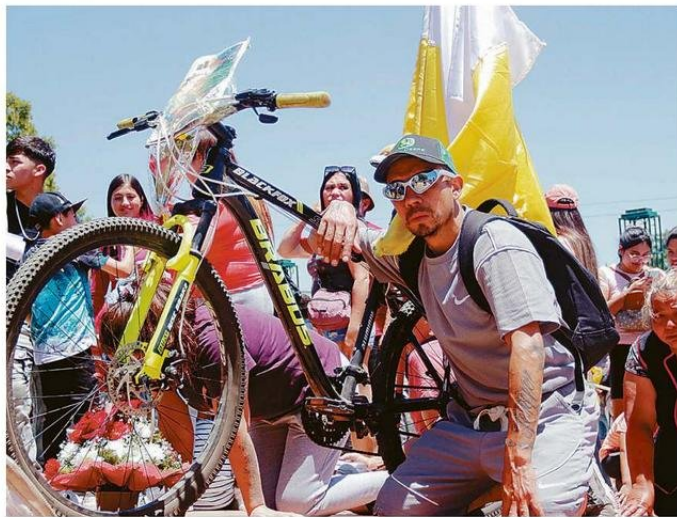
CAMINANDO, EN BICICLETA, MONTANDO UN CABALLO O EN AUTOMÓVILES LLEGAN AL TEMPLO.