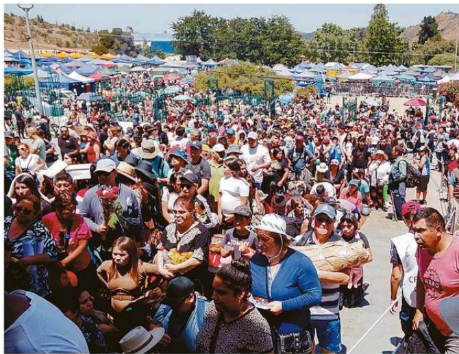
PESE A LAS ALTAS TEMPERATURAS LOS FIELES DE LA VIRGEN NO LA ABANDONAN LOS 8 DE DICIEMBRE.