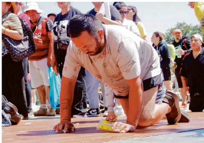
LOS TESTIMONIOS DE FE Y CUMPLIMIENTOS DE MANDAS SON TRADICIONALES EN ESTA FECHA.

grupo, y el viaje es positivo desde el punto de vista deportivo”.