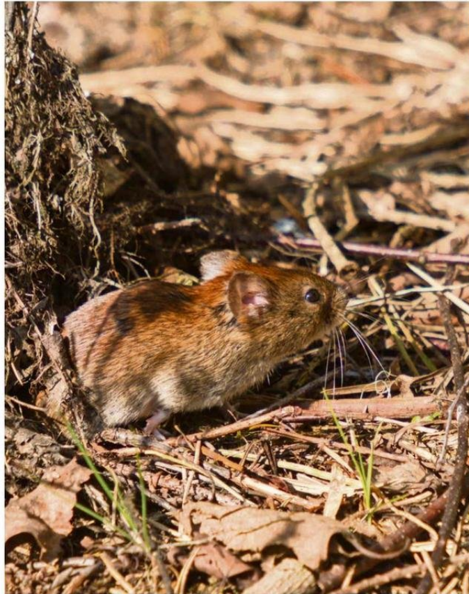
EL OLIGORYZOMYS LONGICAUDATUS ES EL ROEDOR PORTADOR DEL VIRUS ANDES.

Los nanoanticuerpos se consideran una versión simplificada de los anticuerpos convencionales y tienen la capacidad de neutralizar un