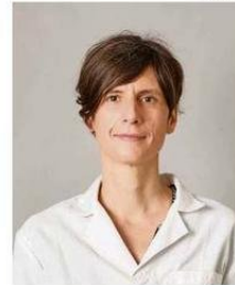
TISCHLER ES BIOTECNÓLOGA.

En esa línea, Tischler comenta que "nos enfocamos en generar un abanico de anticuerpos altamente específicos para el virus Andes, porque sabemos que